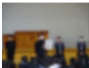
【現役員のあいさつ】

11月1日(水)、令和5年度の生徒会役員交代式を行いました。まず、3年生を中心とした現生徒会役員からの話の場面では、この1年間の活動を振り返り、たくさんの苦労や学び、成長できたことや先輩や後輩、同級生、先生、家族への感謝の言葉など様々な思いがあふれていました。その後、新役員からの感謝の花束贈呈と慰労の言葉があり、生徒会旗の受け渡しを行いました。次に、新生徒会役員の認証式を行い、新役員を代表して新生徒会長から決意の言葉がありました。立会演説会やその後の選考の中で決意した気持ち「初志」を忘れず、1年間頑張っていってほしいと思います。新役員のリーダーシップと今後の活躍を期待しています。