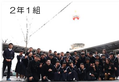
京都駅前、京都タワーをバックに。これで京都ともお別れです。