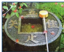
石面に刻まれた吾唯足知の文字