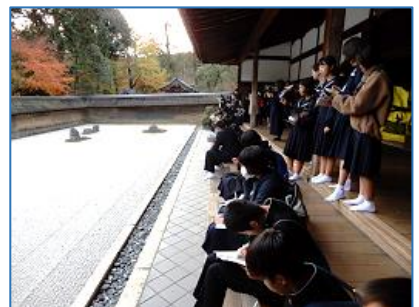
龍安寺石庭で熱心にメモをとる生徒。