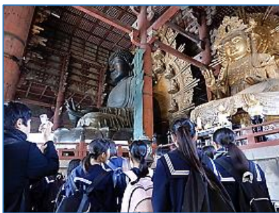
ガイドさんの話に聞き入ります。