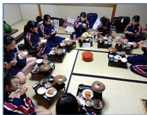
食事は部屋ごとに