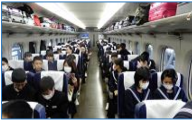
新幹線の車内。新大阪駅に向けて出発。期待に胸が膨らみます。

の東大寺と京都の龍安寺を見学し、3日目は京友禅染め体験を行うなど、京都・奈良の歴史や伝統文化に触れた3日間でした。