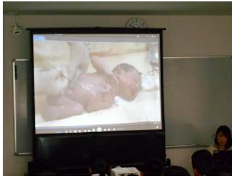
生命誕生の感動のシーン

私たちの命が誕生するまでの過程について学ぶとともに、妊婦体験や赤ちゃんだっこ体験をしました。