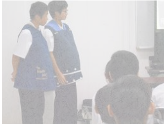
約10キロの重りをつけた妊婦体験