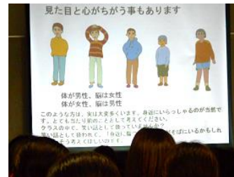
性の多様性について