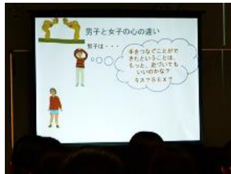
性に関する男子と女子の心の違い